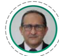
Ebenezer Albuquerque Bezerra Secretário de Administração, Planejamento e Gestão

Lei nº 2.624, de 1 de julho de 2020 (Dom nº4.872, de 1/07/2020)